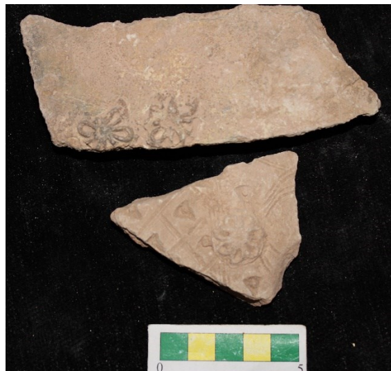
تصویر ۲۶- سفال با نقش افزوده با طرحی شبیه گل، محوطه جیزد.