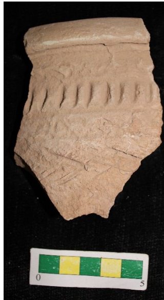
تصویر ۱۴- سفال با نقش کنده ریلی و اریب، محوطه جیزد.

گروه ۱۳- سفالهای با نقش کنده ماریچ درهم به همراه نوارهای عمودی کنده و این دسته سفال تنها از یک ناحیه بدست آمده است و تعداد ۷ عدد از این نوع سفال در طی بررسی بدست آمد (تصویر ۱۵).