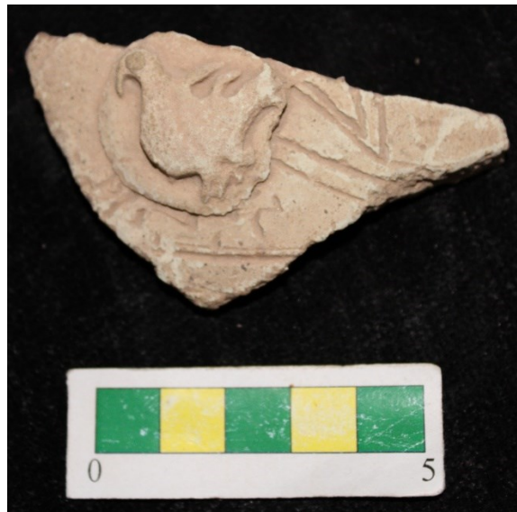
تصویر ۲۵- سفال با نقش افزوده قبه ای و پرنده، محوطه جیزد.