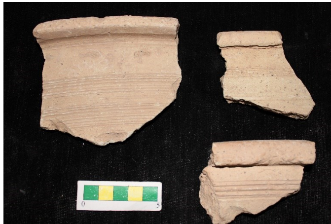
تصویر ۱۲- سفالهای با نقش کنده شانه ای افقی، محوطه جیزد (عکس از نگارندگان).

گروه ۱۱- سفال با نقش کنده دایره ای شانه ای که داخل دایره با همان ابزار شانه ای ۶ ضربه ایجاد شده است و ۱ نمونه از این سفال از محوطه بدست آمد (تصویر ۱۳).