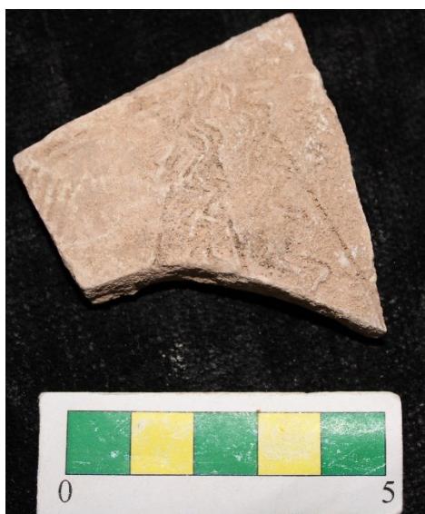
تصویر ۹- سفالهای با نقش کنده مارپیچ شانه ای و خطی عمودی، محوطه جیزد.

گروه ۷- سفالهای با نقش کنده مارپیچ شانه ای به همراه نقش کنده خطی عمودی که تعداد ۱ نمونه از این نوع سفال در طی بررسی از سطح محوطه بدست آمد (تصویر ۹).