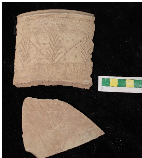
تصویر ۳- سفالهای با نقش کنده منظره ای، محوطه جیزد.

گروه ۱- سفالهای با نقش کنده منظره ای که تصاویری از کوه و درختان و نقوش گیاهی مثل خوشه گندم را در بین طرح های زیگزاگی نشان می دهد و در قسمت بالا با نقوش خطی اریب یا زیگزاگ تزیین شده است و دو نمونه از این نوع سفال از محوطه بدست آمد (تصویر ۳).