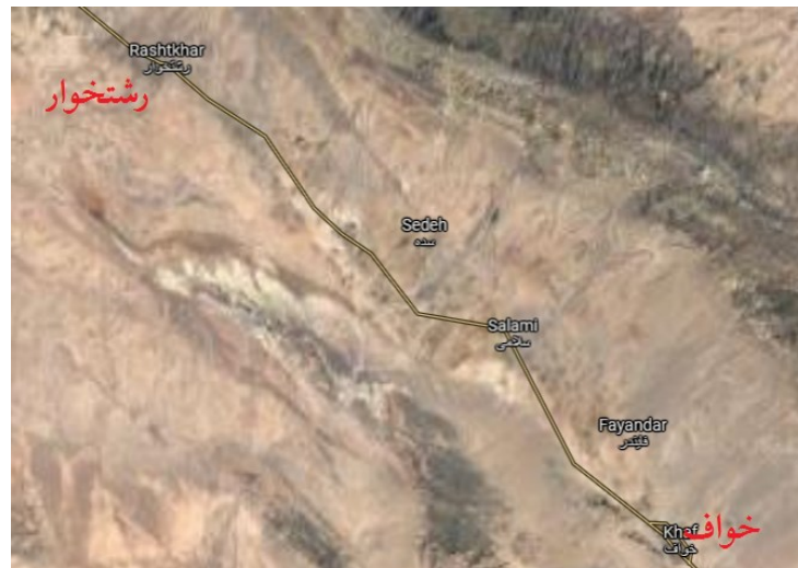
تصویر ۱- موقعیت جغرافیایی دو شهر خواف و رشتخوار