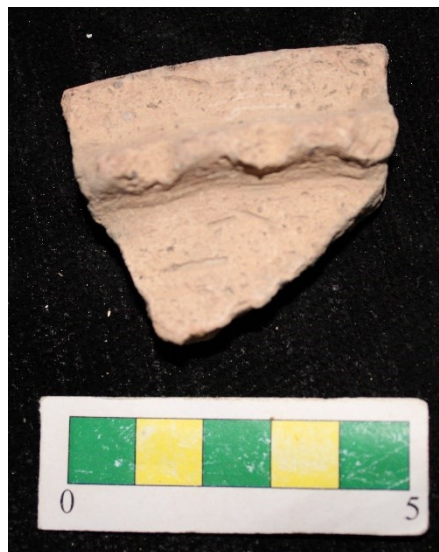
تصویر ۲۱- سفال با نقش افزوده، محوطه جیزد.

گروه ۱۹- گروه دیگری از سفالها، سفال با نقش افزوده است که ۱ نمونه از این نوع سفال در جریان بررسی محوطه بدست آمد (تصویر ۲۱).