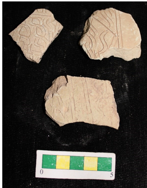
تصویر ۱۵- سفال با نقش کنده ماریچ درهم و نوارهای، محوطه جیزد (عکس از نگارندگان).

گروه ۱۳- سفالهای با نقش کنده ماریچ درهم به همراه نوارهای عمودی کنده و این دسته سفال تنها از یک ناحیه بدست آمده است و تعداد ۷ عدد از این نوع سفال در طی بررسی بدست آمد (تصویر ۱۵).