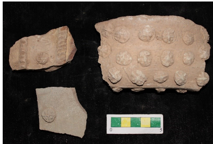
تصویر ۲۳- سفال با نقش افزوده قبه ای و دایره ای، محوطه جیزد.