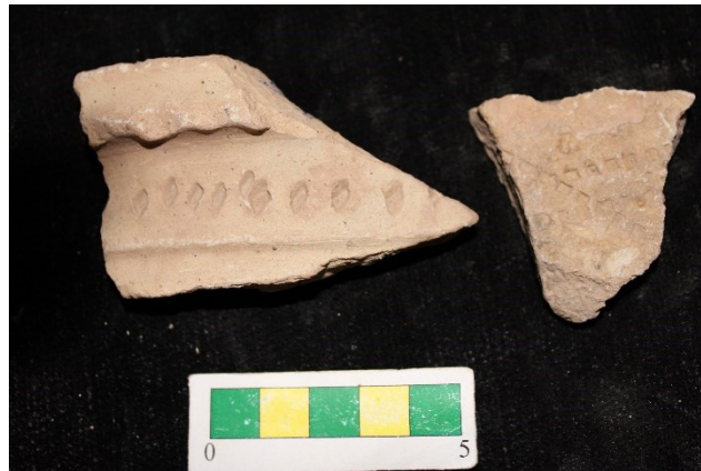
تصویر ۲۲- سفال با نقش کنده لوزی شکل، محوطه جیزد.