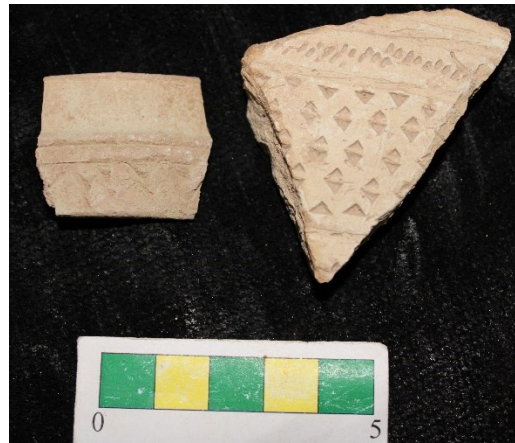
تصویر ۷- سفالهای با نقش کنده مثلثی شکل و تزیین کنده نواری ، محوطه جیزد.

گروه ۵- سفالهای با نقش کنده ایجاد شده با ابزاری مثلثی شکل و تزیین کنده نواری که تعداد ۳ عدد از این نوع سفال در طی بررسی محوطه بدست آمد (تصویر ۷).