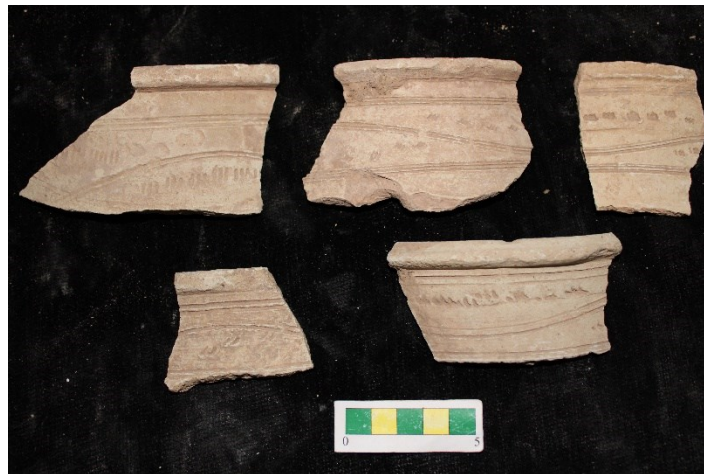
تصویر ۱۱- سفالهای با نقش کنده شانه ای افقی، موج و نقوش کنده ضربه ای، محوطه جیزد.

گروه ۹- سفالهای با نقش کنده شانه ای افقی و نقش کنده موج به همراه نقوش کنده که با ابزار شانه ای به صورت کنده ضربه زده شده است و در برخی نمونه ها نقش روی لبه ایجاد شده است و بجز این دو ویژگی در سایر موارد شبیه گروه ۸ است و تعداد ۲۷ نمونه از این نوع سفال در طی بررسی بدست آمد (تصویر ۱۱).