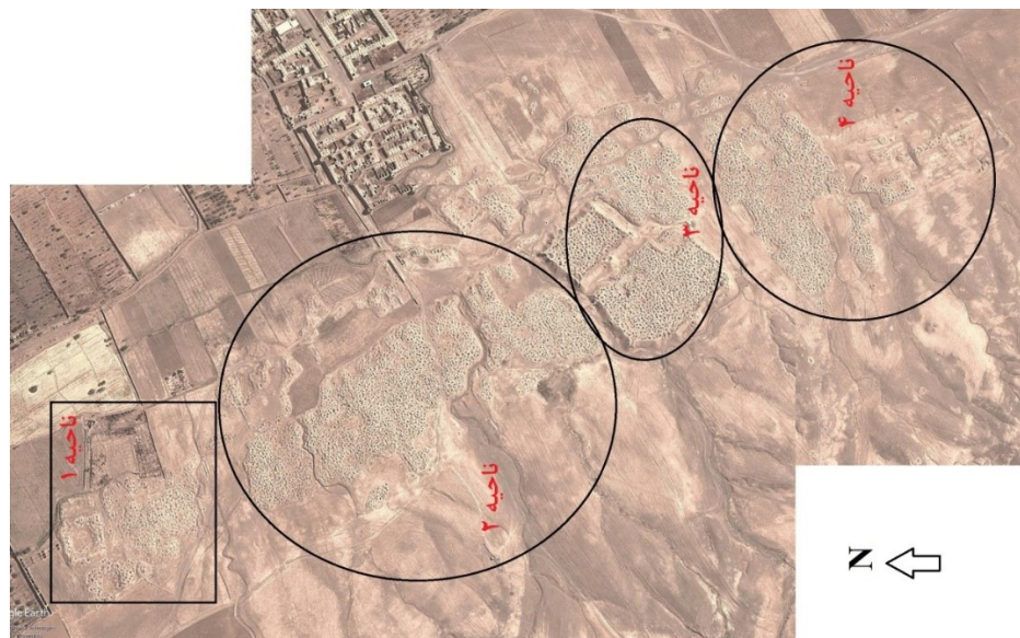
تصویر ۲- تقسیم بندی چهارگانه نواحی محوطه جیزد.