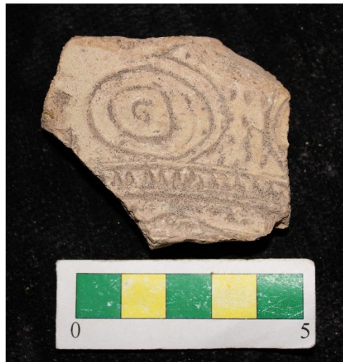
تصویر ۵- سفالهای با نقوش کنده دواير متحدالمركز و نقش کنده ریلی، محوطه جیزد.

گروه ۳- نقوش کنده دواير متحدالمركز و نقش کنده ریلی مانند در قسمت بالا، بین هر نقش دایره متحدالمركز با نقش دایره متحدالمركز بعدی با نقوش کنده نقطه ای جداسازی شده است و تعداد یک نمونه از این نوع سفال بدست آمد (تصویر ۵).