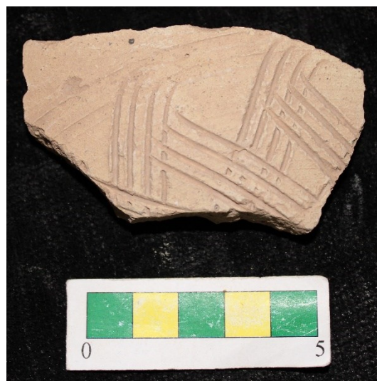
تصویر ۸- سفالهای با نقش کنده جناغی شانه ای، محوطه جیزد.

گروه ۷- سفالهای با نقش کنده مارپیچ شانه ای به همراه نقش کنده خطی عمودی که تعداد ۱ نمونه از این نوع سفال در طی بررسی از سطح محوطه بدست آمد (تصویر ۹).