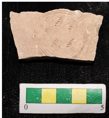
تصویر ۱۳- سفالهای با نقش کنده شانه ای افقی، محوطه جیزد.

گروه ۱۱- سفال با نقش کنده دایره ای شانه ای که داخل دایره با همان ابزار شانه ای ۶ ضربه ایجاد شده است و ۱ نمونه از این سفال از محوطه بدست آمد (تصویر ۱۳).