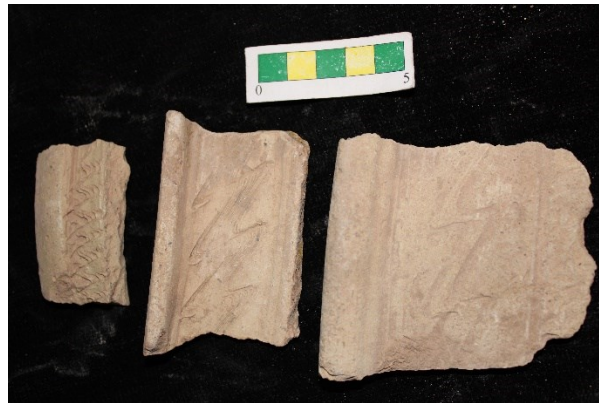
تصویر ۴- سفالهای با نقش کنده زیگزاگ یا شانه ای، محوطه جیزد (عکس از نگارندگان).

گروه ۳- نقوش کنده دواير متحدالمركز و نقش کنده ریلی مانند در قسمت بالا، بین هر نقش دایره متحدالمركز با نقش دایره متحدالمركز بعدی با نقوش کنده نقطه ای جداسازی شده است و تعداد یک نمونه از این نوع سفال بدست آمد (تصویر ۵).