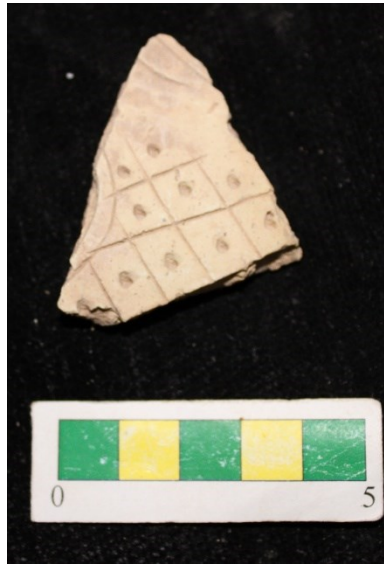
تصویر ۲۰- سفال با نقش کنده حصیری، محوطه جیزد.

گروه ۱۹- گروه دیگری از سفالها، سفال با نقش افزوده است که ۱ نمونه از این نوع سفال در جریان بررسی محوطه بدست آمد (تصویر ۲۱).