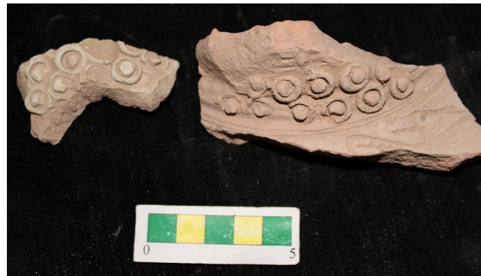
تصویر ۲۴- سفال با نقش افزوده با طرح انگوری، محوطه جیزد.