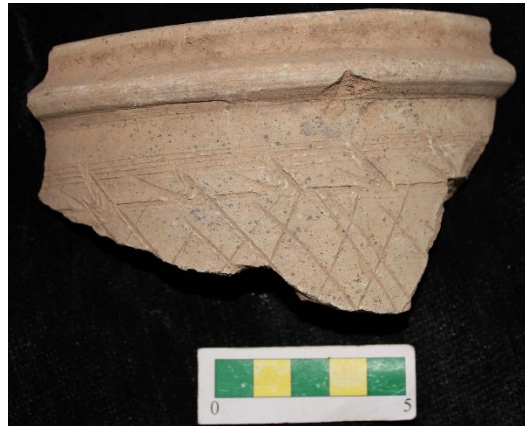
تصویر ۶- سفالهای با نقش کنده شانه ای و حصیری، محوطه جیزد.

گروه ۵- سفالهای با نقش کنده ایجاد شده با ابزاری مثلثی شکل و تزیین کنده نواری که تعداد ۳ عدد از این نوع سفال در طی بررسی محوطه بدست آمد (تصویر ۷).