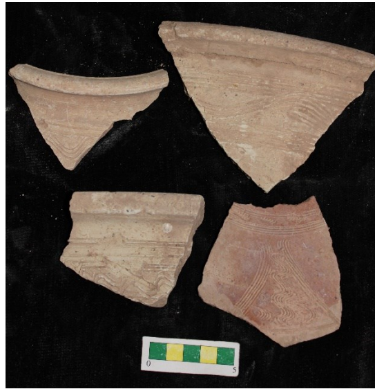
تصویر ۱۰- سفالهای با نقش کنده شانه ای افقی و موج، محوطه جیزد.

گروه ۹- سفالهای با نقش کنده شانه ای افقی و نقش کنده موج به همراه نقوش کنده که با ابزار شانه ای به صورت کنده ضربه زده شده است و در برخی نمونه ها نقش روی لبه ایجاد شده است و بجز این دو ویژگی در سایر موارد شبیه گروه ۸ است و تعداد ۲۷ نمونه از این نوع سفال در طی بررسی بدست آمد (تصویر ۱۱).